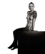
Frankie 95 x 75 cm