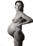
Emā Hapu 95 x 75 cm