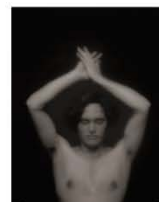
Layne 95 x 75 cm