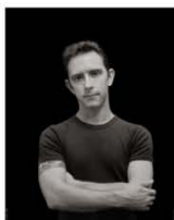
Mark boy 95 x 75 cm