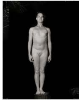
Norrie 95 x 75 cm