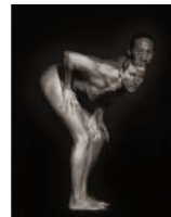
Merge 95 x 75 cm