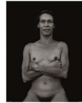
Rusty 95 x 75 cm