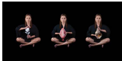
Ola aitu maui the inner person 95 x 48 cm