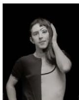
Mark boy/girl 95 x 75 cm