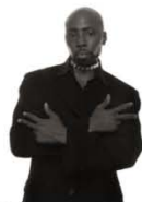
Dred boy 95 x 75 cm