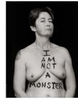
Mani 95 x 75 cm