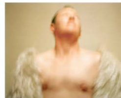
Transcend 75 x 95 cm