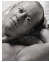
Jack 95 x 75 cm