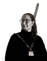
Georgina 95 x 75 cm