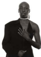
Dred boy/girl 95 x 75 cm