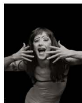
Mark girl 95 x 75 cm