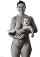
Emā and Taaniko 95 x 75 cm