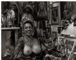
Carmen 75 x 95 cm