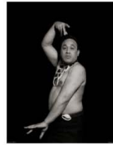
Karl 95 x 75 cm