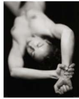
Jen 95 x 75 cm